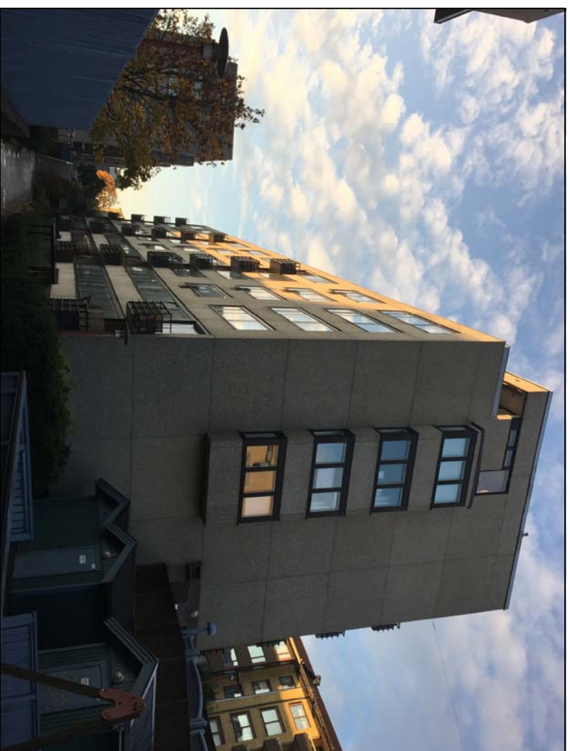
HUS N - Vy från Gärd Fasader mot Öster respektive Norr